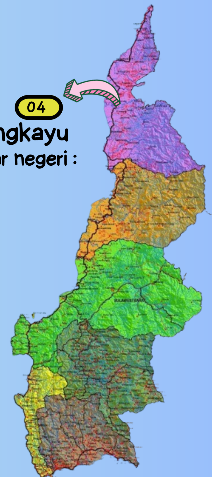
PETA PROVINSI SULAWESI BARAT

Wilker Pel Pasangkayu Ada 1 kapal dari luar negeri : Malaysia